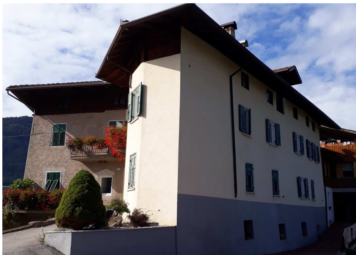
Vista da est