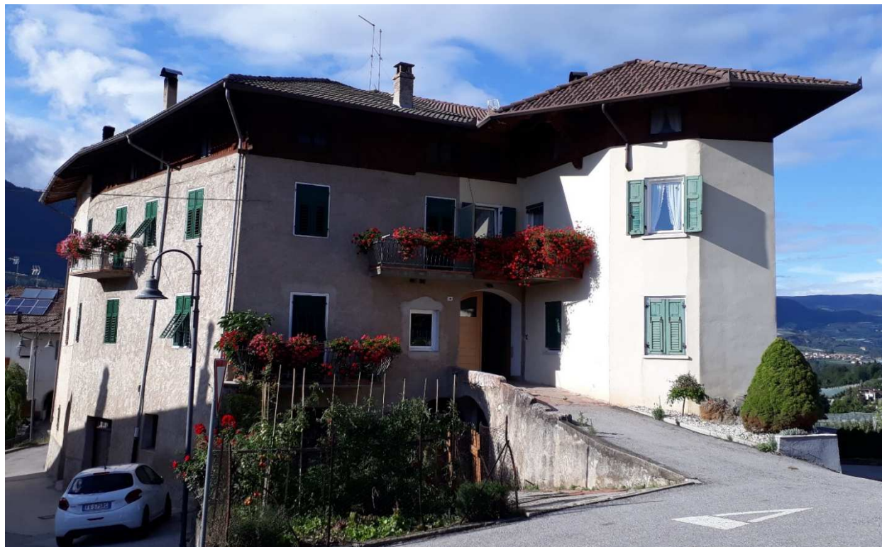
Vista da sud